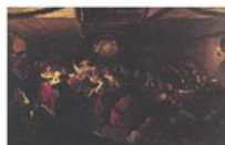
p0005 Wedding dance in Vingaker (Bröllopsdans i Vingaker)